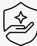
Ritiro e restituzione per 3 anni U1PS3E