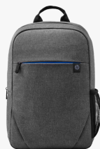
Zaino HP Prelude da 15,6" 2Z8P3AA