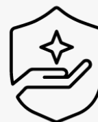
Ritiro e restituzione per 3 anni U1PS3E