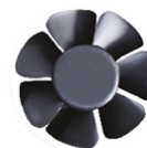
PALE DELLA VENTOLA SPECIALI