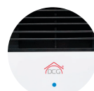
SENSORE LIVELLO ACQUA E SPIA LUMINOSA