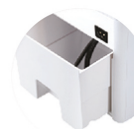
FACILE DA RIEMPIRE E DA PULIRE