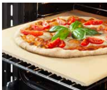
COTTURA 300°C E PIZZA STONE