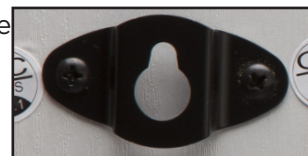
Supporti per installazione a parete

Sul retro delle WB-100 MIC sono presenti delle asole metalliche per una semplice installazione a parete.