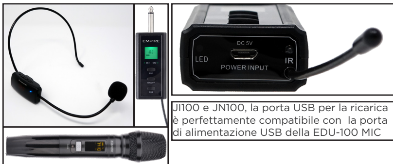
JI100 e JN100, la porta USB per la ricarica è perfettamente compatibile con la porta di alimentazione USB della EDU-100 MIC

Nel pannello comandi è presente una porta di alimentazione USB 5V 2A . Oltre a ricaricare dispositivi come Cellulari, Tablet, ecc. è stata ideata per fornire un'alimentazione continua al ricevitore dei Microfoni UHF JN100 e JI100 per un utilizzo prolungato.