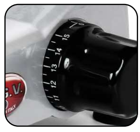
Manopola graduata per un taglio preciso.