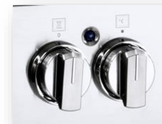
Nuove manopole in metallo spazzolato con ghiera