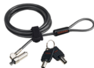
Blocco cavo con chiave ultrasottile (PA5364U-1KCL)