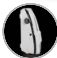
Posizione verticale salvaspazio