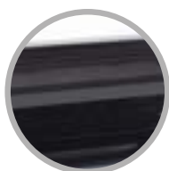
Barra sigillante dimensione doppia