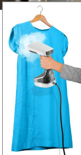
ACCESS STEAM+ Stiratrice portatile DR8135D1