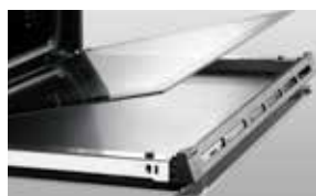
VETRO FACILMENTE ESTRAIBILE