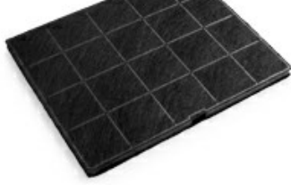
Filtro Carbone 08999113