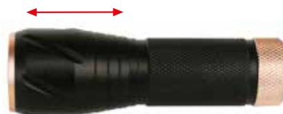
Ottica lenticolare regolabile