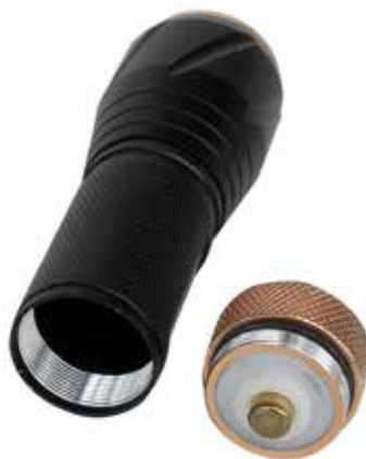
Pacco batterie estraibile