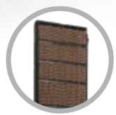
Speciale pannello evaporativo