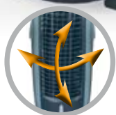
Flusso d'aria direzionabile da 60° a 120°