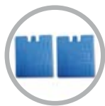
2 Ice boxes per aumentare l'effetto raffrescante