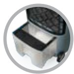
Serbatoio per carico acqua da 15 litri