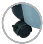
Rotelle anteriori piroettanti con blocco