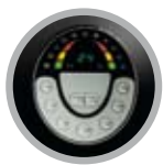
Pannello comandi soft touch