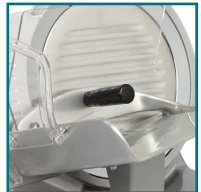
Pressamerce con protezione in plexiglass. Food-holder arm with protection in plexiglass.