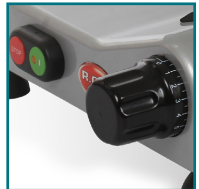
Manopola graduata ed interruttore per centralina CEV. Graduated knob and switch linked to CEV control unit.