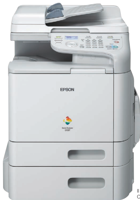
Il modello mostrato è Epson AcuLaser CX37DTNF

La serie Epson AcuLaser CX37DN consente ai gruppi di lavoro medio-grandi di effettuare stampe in formato A4 fronte/retro, fotocopie e scansioni, sia in bianco e nero che a colori. I modelli CX37DNF e CX37DTNF sono inoltre dotati di fax. L'alimentatore automatico di documenti è di serie, e il vassoio carta aggiuntivo opzionale consente ai gruppi di lavoro di risparmiare tempo e accrescere ulteriormente la produttività grazie al veloce e semplice aumento della capacità carta.