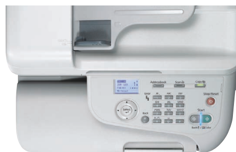
I comandi, chiari e accessibili, rendono la serie Epson AcuLaser CX37DN semplice e intuitiva.