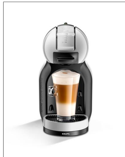
MINI ME KP123 KP123B10