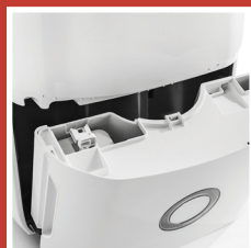
Serbatoio per la raccolta della condensa facilmente rimovibile Condensate collection tank easy to be removed