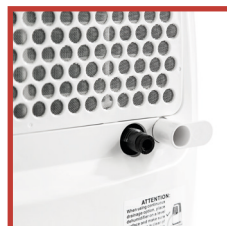
Attacco per drenaggio condensa continuo Fitting for continuous condensate drainage