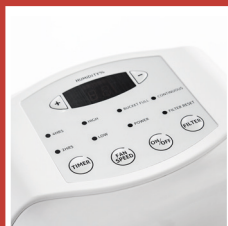
Pannello di controllo digitale Digital control panel

Disponibile solo per il mercato estero Available only for foreign market