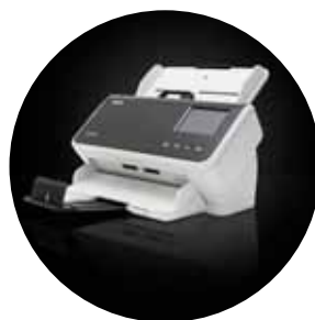
Scanner Alaris S2060w/S2080w