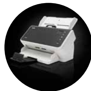
Scanner Alaris S2040/S2050/S2070