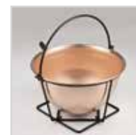
Capacità 5,3L per 4/10 persone Capacity 5,3L for 4/10 persons