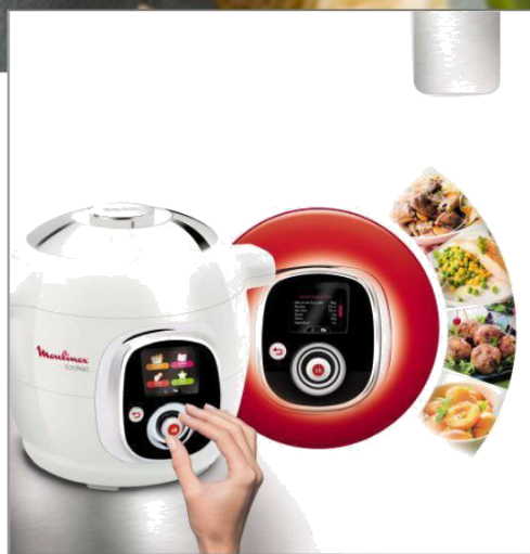
COOKEO IT CE706 CE706121