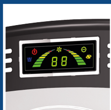
Display a LED LED display