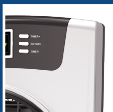
Pannello comandi manuale Manual control panel

Here is an alternative way to improve comfort, both inside and outside, simply by ventilating and/or nebulizing the water from the internal tank.