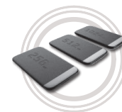
Unità SSD USB-C Lenovo