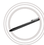
Lenovo Active Pen 2