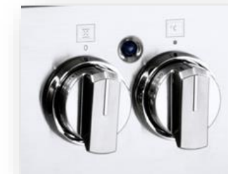
Nuove manopole in metallo spazzolato con ghiera