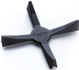
Porta Wok in Ghisa 9601 668