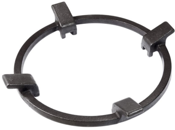
Porta Wok in Ghisa 9601 727