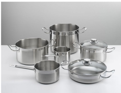
Batteria pentole Induction PRO 8pz. 8210 008