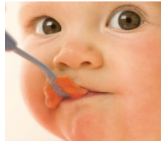
Recipe booklet Nutritious meals made easy PHILIPS AVENT www.philips.com/avent

Insieme ai nostri nutrizionisti e psicologi dell'infanzia, abbiamo ideato per te 12 ricette adatte alle varie età e aggiunto consigli sullo svezzamento, per offrire al tuo bambino un'alimentazione salutare fin da piccolo e ottime abitudini alimentari per tutta la vita.