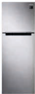
RT 32K5030 S8 cod. EAN 8806088228150