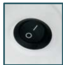
Interrupteur sur socle