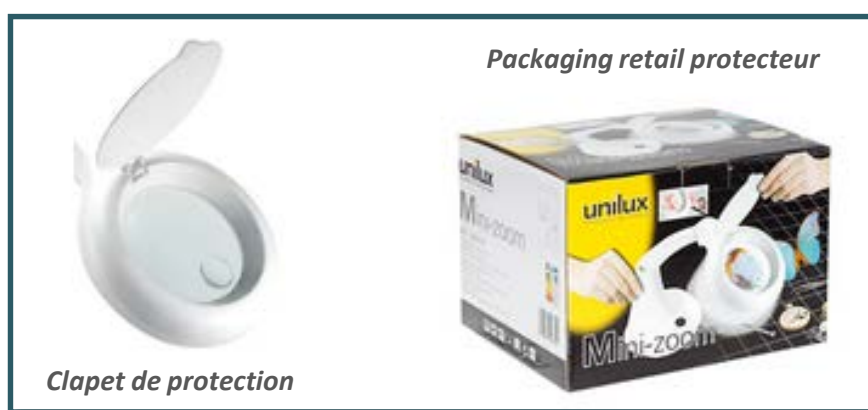
Clapet de protection